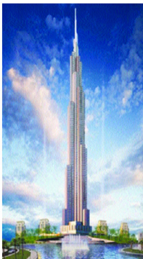
ਦੁਬਈ ਵਿਖੇ ਸ਼ੀਬਰ ਦੁਨੀਆਂ ਦੀ ਸਭ ਤੋਂ ਉੱਚੀ ਇਮਾਰਤ ‘ਬੁਰਜ਼ ਖਲੀਫਾ’ ਦਾ ਇੱਕ ਦ੍ਰਿਸ਼

ਉਨੀਵੀਂ ਸਦੀ ਦੇ ਸ਼ੁਰੂ ਵਿੱਚ ਬਾਨੀ ਯਾਸ (ਬਨਿਆਸ) ਕਬੀਲੇ ਦੇ ਕੁੱਝ ਮੈਂਬਰ ਸ਼ੇਖ਼ ਮਕਤੂਮ ਬਿਨ ਬੁਟੀ ਦੀ ਅਗਵਾਈ ਵਿੱਚ ਅਬੂਧਾਬੀ ਛੱਡ ਕੇ ਉੱਤਰ ਵੱਲ ਦੇ ਇਲਾਕੇ ਵਿੱਚ ਆ ਕੇ ਵੱਸ ਗਏ ਸਨ ਅਤੇ ਉਨ੍ਹਾਂ ਨੇ ਆਪਣੀ ਵੱਖਰੀ ਰਿਆਸਤ ਬਣਾ ਲਈ, ਜਿਸ ਨੂੰ ਦੁੱਬਈ ਦੇ ਨਾਮ ਦਿੱਤਾ ਗਿਆ। ਬਸਤੀਵਾਦ ਦੇ ਖ਼ਾਤਮੇ ਉੱਪਰੰਤ ਅਰਬ ਸ਼ੇਖਾਂ ਦੀਆਂ ਮੁੱਖ-ਮੁਖਤਿਆਰ ਰਿਆਸਤਾਂ ਅੰਦਰ ਏਕਤਾ ਦੀ ਭਾਵਨਾ ਪੂਰੇ ਜ਼ੋਰ ਨਾਲ ਉੱਭਰੀ। ਸਭ ਤੋਂ ਪਹਿਲਾਂ ਵੱਡੀਆਂ ਦੋ ਰਿਆਸਤਾਂ ਆਬੂਧਾਬੀ ਅਤੇ ਦੁਬਈ ਨੇ 19 ਵਰਵਰੀ 1968 ਨੂੰ ਇੱਕ ਦੂਜੇ ਨਾਲ ਏਕਤਾ ਦਾ ਸਮਝੌਤਾ ਕੀਤਾ। ਫਿਰ 2 ਦਸੰਬਰ 1971 ਨੂੰ ਚਾਰ ਹੋਰ ਰਿਆਸਤਾਂ ਸ਼ਾਰਜ਼ਾਹ, ਅਜਮਾਨ, ਉਮ-ਅਲ-ਕੁਵੈਨ ਅਤੇ ਫੁਜੈਰਾ ਨੇ ਵੀ ਇਸ ਸਮਝੌਤੇ ਨੂੰ ਸਵੀਕਾਰ ਕਰ ਲਿਆ। 10 ਫਰਵਰੀ 1972 ਨੂੰ ਸੱਤਵੀਂ ਰਿਆਸਤ, ਰਾਸ-ਅਲ-ਖੇਮਾ ਨੇ ਵੀ ਸੰਯੁਕਤ ਅਰਬ ਅਮੀਰਾਤ ਵਿੱਚ ਸ਼ਾਮਲ ਹੋਣ ਦਾ ਫੈਸਲਾ ਕਰ ਲਿਆ। ਸੱਤਾਂ ਦੀ ਰਿਆਸਤਾਂ ਵਿੱਚ ਸਭ ਤੋਂ ਵੱਡੀ ਅਤੇ ਆਰਥਿਕ ਤੌਰ ਤੇ ਸ਼ਕਤੀਸ਼ਾਲੀ ਰਿਆਸਤ ਆਬੂਧਾਬੀ ਹੈ ਜਿਸ ਦੇ ਅਧੀਨ 65,250 ਵਰਗ ਕਿਲੋਮੀਟਰ ਦਾ ਖੇਤਰ ਆਉਂਦਾ ਹੈ। ਇਹ ਰਕਬਾ ਦੁਬਈ ਤੋਂ ਵੱਡਾ ਸਾਰੀਆਂ ਰਿਆਸਤਾਂ ਦੇ ਕੁੱਲ ਰਕਬੇ ਤੋਂ ਵੀ ਵੱਡੀ ਗੁਣਾ ਜਿਹਾ ਆਉਂਦਾ ਹੈ। ਇਸ ਦੇ ਨਾਲ ਲੱਗਦੀ ਦੁਬਈ ਰਿਆਸਤ ਦਾ ਕੁੱਲ ਰਕਬਾ 3900 ਵਰਗ ਕਿਲੋਮੀਟਰ ਹੈ। ਤੀਜੀ ਵੱਡੀ ਰਿਆਸਤ ਸ਼ਾਰਜ਼ਾਹ ਤੇ ਚੌਥੀ ਰਾਸ-ਅਲ-ਖੇਮਾ ਹੈ, ਜਿਸ ਕੁੱਲ 1700 ਵਰਗ ਕਿਲੋਮੀਟਰ ਖੇਤਰ ਹੈ। ਫੁਜੈਰਾ ਕੁੱਲ 1150 ਵਰਗ ਕਿਲੋਮੀਟਰ ਤੇ ਉਮ-ਅਲ-ਕੁਵੈਨ ਕੁੱਲ 750 ਵਰਗ ਕਿਲੋਮੀਟਰ ਕੁੱਲ ਰਕਬਾ ਹੈ। ਸਭ ਤੋਂ ਛੋਟੀ ਰਿਆਸਤ ਅਜਮਾਨ ਕੁੱਲ ਸਿਰਫ਼ 250 ਵਰਗ ਕਿਲੋਮੀਟਰ ਦਾ ਰਕਬਾ ਹੈ। ਅੱਜੋਂ ਵੀ ਇੱਕ ਆਬੂਧਾਬੀ ਵਿੱਚ ਰਹਿਣ ਵਾਲੇ 75 ਫੀਸਦੀ ਲੋਕ ਫਲਸਤੀਨੀ ਸਨ। ਭਾਰਤ-ਪਾਕਿਸਤਾਨ ਅਤੇ ਦੂਜੇ ਹੋਰ ਏਸ਼ੀਆਈ ਦੇਸ਼ਾਂ ਤੋਂ ਆਬਾਦੀ ਦੇ ਤਬਦੀਲੀਆਂ ਕਾਰਨ ਹੁਣ ਆਬੂਧਾਬੀ ਅਤੇ ਦੁਬਈਆਂ ਰਿਆਸਤਾਂ ਦਾ ਆਬਾਦੀ ਪੱਧ ਤਾਂ ਮੁਹੱਬਤਾ ਬਲਦੀ ਗਿਆ ਹੈ। ਸੰਨ 1995 ਵਿੱਚ ਸਮੁੱਚੇ ਸੰਯੁਕਤ ਅਰਬ ਅਮੀਰਾਤ (ਯੂ. ਏ. ਈ.) ਦੀ ਜਨਸੰਖਿਆ 24 ਲੱਖ 11 ਹਜ਼ਾਰ