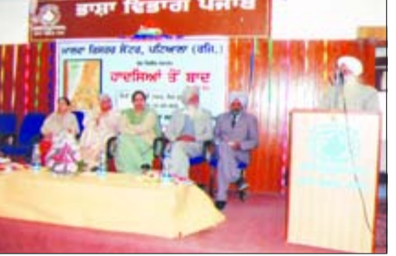
ਪੁਸਤਕ ਰਿਲੀਜ਼ ਸਮਾਗਮ ਦੌਰਾਨ ਬੁਲਾਰੇ ਸੰਬੋਧਨ ਕਰਦੇ ਹੋਏ।

ਪਟਿਆਲਾ, 3 ਫਰਵਰੀ (ਅ.ਬ.)- ਪੰਜਾਬੀ ਕਾਵਿ ਵਿਚ ਇਸਤਰੀਤਵ ਦੀ ਪਹਿਚਾਣ ਅਤੇ ਇਸਤਰੀਵਾਦ ਦੇ ਤਰ੍ਹਾਂ ਦੇ ਰੁਝਾਨ ਚੱਲ ਰਹੇ ਹਨ। ਇੱਕ ਇਸਤਰੀਤਵ ਦੀ ਪਹਿਚਾਣ ਵਾਲਾ ਕਾਵਿ ਜਿੱਥੇ ਲੋਕਾਇਤੀ ਸਰਕਾਰਾਂ ਨਾਲ ਜੁੜੀ ਹੋਈ ਨਾਰੀ ਸ਼ਕਤੀ ਦੇ ਸਿਰਜਨਾਤਮਕ ਸਰਕਾਰਾਂ ਨੂੰ ਸੰਬੋਧਨ