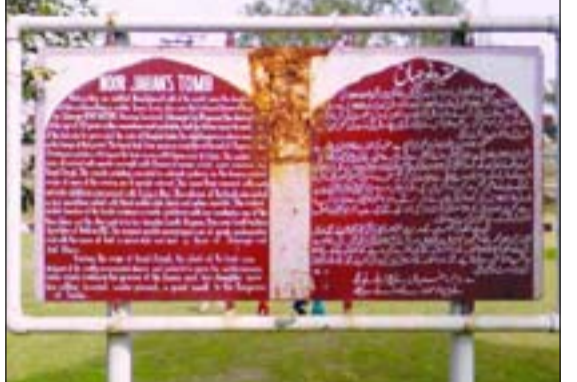
ਨੁਰਜਹਾਂ ਦੇ ਮਕਬਰੇ ਦੇ ਬਾਹਰ ਲੱਗਾ ਬੋਰਡ, ਜਿਸ ਦੇ ਹੇਠਲੇ ਪਹਿਰੇ 'ਚ ਸਾਫ਼-ਸਾਫ਼ ਲਿਖਿਆ ਹੈ ਕਿ ਮਹਾਰਾਜਾ ਰਣਜੀਤ ਸਿੰਘ ਨੇ ਇੱਥੋਂ ਸੰਗਮਰਮਰ ਉਤਰਵਾ ਕੇ ਅੰਮ੍ਰਿਤਸਰ ਸ੍ਰੀ ਹਰਿਮੰਦਰ ਸਾਹਿਬ 'ਚ ਲਗਵਾਇਆ।