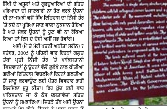
ਜਹਾਂਗੀਰ ਦੇ ਮਕਬਰੇ ਦੇ ਬਾਹਰ ਲੱਗਾ ਬੋਰਡ, ਜਿਸ ਦੇ ਹੇਠਲੇ ਪਹਿਰੇ 'ਚ ਸਾਫ਼-ਸਾਫ਼ ਲਿਖਿਆ ਹੈ ਕਿ ਮਹਾਰਾਜਾ ਰਣਜੀਤ ਸਿੰਘ ਨੇ ਇੱਥੋਂ ਸੰਗਮਰਮਰ ਉਤਰਵਾ ਕੇ ਅੰਮ੍ਰਿਤਸਰ ਸ੍ਰੀ ਹਰਿਮੰਦਰ ਸਾਹਿਬ 'ਚ ਲਗਵਾਇਆ।