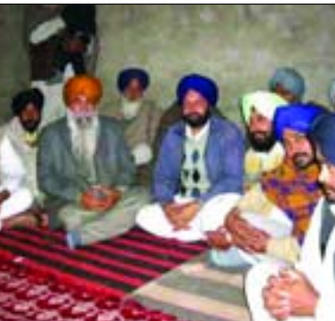
ਪਿੰਡ ਦਰਜਨ ਵਿਖੇ ਭਗਤ ਪੰਨਾ ਜੱਟ ਦੇ ਜਨਮ ਦਿਹਾੜੇ 'ਤੇ ਪਹੁੰਚੇ ਵਿਧਾਇਕ ਨੂੰ ਮੰਗ ਪੱਤਰ ਦਿੰਦੇ ਹੋਏ।