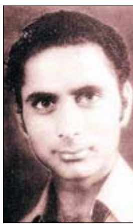
ਪੰਜਾਬੀ ਸ਼ਾਇਰ ਪਾਸ