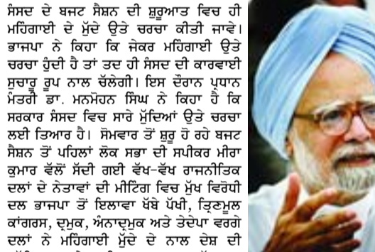
ਸਮੀਖਿਆ 25 ਫਰਵਰੀ ਨੂੰ ਪੇਸ਼ ਕੀਤੀ ਜਾਵੇਗੀ।

ਕੀਤੀ। ਮੀਟਿੰਗ ਤੋਂ ਬਾਅਦ ਭਾਜਪਾ ਦੀ ਸ਼ੁਸ਼ਾ ਸਰਕਾਰ ਨੇ ਕਿਹਾ ਕਿ ਸਾਰੇ ਵਿਰੋਧੀ ਦਲ ਇਸ ਗੱਲ ਉੱਤੇ ਸਹਿਮਤ ਹਨ ਕਿ ਮਹਿੰਗਾਈ ਮੁੱਦੇ ਉੱਤੇ ਤੁਰੰਤ ਚਰਚਾ ਹੋਣੀ ਚਾਹੀਦੀ ਹੈ ਅਤੇ ਇਹ 23 ਫਰਵਰੀ ਨੂੰ ਹੀ ਹੋਵੇ।