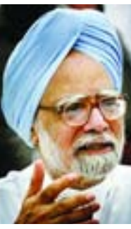
ਪ੍ਰਧਾਨ ਮੰਤਰੀ ਮਨਮੋਹਨ ਸਿੰਘ

ਵਿਰੁਧ ਖੁਲ੍ਹੇ ਦਾ ਸਾਹਮਣਾ ਆ ਰਿਹਾ ਹੈ। ਇਸ ਲਈ ਸਾਨੂੰ ਹੋਰ ਖੇਤਰ ਵਿੱਚ ਜਵਾਬਦੇਹੀ ਦਾ ਮਾਹੌਲ ਤਿਆਰ ਕਰਨਾ ਪਵੇਗਾ। ਡਾ. ਮਨਮੋਹਨ ਸਿੰਘ ਨੇ ਰਾਜਾਂ ਨੂੰ ਖੇਤੀਬਾੜੀ ਉਤਪਾਦਨ ਵਿੱਚ ਵਾਧਾ ਕਰਨ ਅਤੇ ਜ਼ਰੂਰੀ ਵਸਤਾਂ ਦੀ ਬੁਣ ਦੂਰ ਕਰਨ ਵੱਲ ਵਿਸ਼ੇਸ਼ ਧਿਆਨ ਦੇਣ ਦੀ ਲੋੜ 'ਤੇ ਜ਼ੋਰ ਦਿੱਤਾ। ਰਾਜਾਂ ਨੂੰ ਕੇਂਦਰ ਵੱਲੋਂ ਹਰ ਸੰਭਵ ਸਹਾਇਤਾ ਦਾ ਯਕੀਨ ਦਵਾਇਆ। ਉਨ੍ਹਾਂ ਨੇ ਕਿਹਾ ਕਿ ਦੇਸ਼ ਵਿੱਚ ਖੇਤੀਬਾੜੀ ਵਿੱਚ ਉਤਪਾਦਨ ਵਿੱਚ ਵਾਧਾ ਕਰਨ ਦੀ ਅਜੇ ਬਹੁਤ ਗੁੰਜਾਇਸ਼ ਬਾਕੀ ਹੈ। ਦੇਸ਼ ਵਿੱਚ ਜਨਤਕ ਵੰਡ ਪ੍ਰਣਾਲੀ ਨੂੰ ਹੋਰ ਢੁਕਵਾਂ ਤੇ ਮਜ਼ਬੂਤ ਬਣਾਏ ਜਾਣ ਦੀ ਲੋੜ ਹੈ ਤਾਂ ਜੋ ਗਰੀਬ ਤੇ ਆਮ ਲੋਕਾਂ ਨੂੰ ਸਮੇਂ ਸਿਰ ਮੁੱਲ ਉੱਤੇ ਜ਼ਰੂਰੀ ਵਸਤਾਂ ਮੁਹੱਈਆ ਕਰਵਾਈਆ ਜਾ ਸਕਣ। ਪ੍ਰਧਾਨ ਮੰਤਰੀ ਨੇ ਕਿਹਾ ਕਿ ਕਮਜ਼ੋਰ ਮੁਦਲਾ ਢਾਂਚਾ ਤਰੱਕੀ ਵਿੱਚ ਰੁਕਾਵਟ ਬਣਦਾ ਹੈ। ਉਨ੍ਹਾਂ ਕਿਹਾ ਕਿ ਸਰਕਾਰ