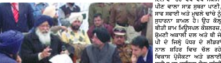
ਮੁਕਤਸਰ ਸਾਹਿਬ ਵਿਖੇ ਮੁਕਤਸਰ ਸਾਹਿਬ ਦੀ ਕਾਇਆ ਕਲਪ ਲਈ 30 ਕਰੋੜ ਪ੍ਰਵਾਨ