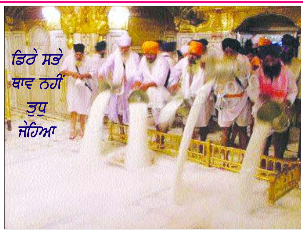
ਡਿਠੇ ਸਭੇ ਥਾਵ ਨਹੀਂ ਤੁਧੁ ਜੋਹਿਆ

ਸਿੱਖ ਧਰਮ ਸੰਸਾਰ ਦਾ ਆਧੁਨਿਕ ਧਰਮ ਹੈ, ਜਿਸ ਵਿਚ ਅਕਾਲ ਪੁਰਖ ਨੂੰ ਸਵੀਕਾਰਨ, ਮੰਨਣਾ ਅਤੇ ਜਪਣ ਦਾ ਉਪਦੇਸ਼ ਦਿੱਤਾ ਕਰਵਾਇਆ ਗਿਆ ਹੈ। ਗੁਰਮਤਿ ਵਿਚਾਰਧਾਰਾ ਅਨੁਸਾਰ ਪ੍ਰਭੂ ਪਰਮਾਤਮਾ ਨੂੰ ਪਾਉਣ-ਗਿਣਾਉਣ ਦਾ ਢੰਗ ਤਰੀਕਾ ਸੇਵਾ ਅਤੇ ਸਿਮਰਨ ਹੈ। ਸੇਵਾ ਪ੍ਰਭੂ ਭਗਤੀ ਦਾ ਨਿਰਮਲ ਨਿਸ਼ਕਾਮ ਸਾਧਨ ਹੈ। ਸੇਵਾ ਕਰਨ ਵਾਲਾ ਮਨੁੱਖ ਕੇਵਲ ਆਪਾ ਹੀ ਨਹੀਂ ਸੇਵਾਦਾਰ, ਸਗੋਂ ਸਮਾਜ ਅਤੇ ਮਾਨਵਤਾ ਵਾਸਤੇ ਸਦਉਪਯੋਗੀ ਘਾਲਣਾ ਘਾਲਦਾ ਹੈ। ਸ੍ਰੀ ਗੁਰਮਿੰਦਰ ਸਾਹਿਬ ਦਾ ਵਾਤਾਵਰਣ ਵਿਲੱਖਣ, ਵਿਸ਼ੇਸ਼ ਵਿਸ਼ਮਾਦੀ ਹੈ। ਗੁਰੂ ਪ੍ਰੇਮੀ ਪਰਿਕ੍ਰਮਾ 'ਚ ਸੋਸ ਝੁਕਾ, ਸਰਦਲ ਨੂੰ ਫੂਹ, ਨਤਮਸਤਕ ਹੋ ਇਲਾਹੀ ਅਨੁਭਵ ਮਹਿਸੂਸ ਕਰਦੇ ਹਨ। ਗੁਰਮਿੰਦਰ ਸਾਹਿਬ 'ਚ ਲੱਗੀ ਹਰ ਵਸਤ ਭਾਵੇਂ ਉਹ ਇੱਟਾਂ, ਪੱਥਰ, ਸੰਗਮਰਮਰ, ਸੋਨਾ, ਚਾਂਦੀ, ਚਾਂਦਰਾ, ਗਲੀਚੇ, ਮੋਟ, ਰੁਮਾਲ, ਤੌਲੀਏ, ਪੱਤਲ, ਬਰਤਨ ਆਦਿ ਹੋਣ, ਹਰ ਵਸਤ ਦੀ ਰੋਜ਼ਾਨਾ ਸੇਵਾ ਸੰਭਾਲ ਹੁੰਦੀ ਹੈ। ਸ੍ਰੀ ਗੁਰਮਿੰਦਰ ਸਾਹਿਬ 'ਚ ਰੋਜ਼ਾਨਾ ਹੋ ਰਹੀਆਂ ਸੇਵਾਵਾਂ ਨੂੰ ਅੱਜ ਇਸ ਤਰ੍ਹਾਂ ਵੰਡ ਸਕਦੇ ਹਾਂ- ਸੂਕੀ ਸੇਵਾ, ਇਸ਼ਨਾਨ ਦੀ ਸੇਵਾ, ਪਰਿਕ੍ਰਮਾ ਦੀ ਧੁਲਾਈ ਦੀ ਸੇਵਾ, ਸਵੱਛੇ ਪੜਨ ਦੀ ਸੇਵਾ, ਕਿਰਪਾਨ ਭੇਟ ਕਰਨ, ਕੜਾਹ ਪੁਸ਼ਾਈ ਵਰਤਾਉਣ, ਸੰਗਤਾਂ ਨੂੰ ਤਰਤੀਬ ਦੇਣ, ਕੀਰਤਨ ਕਰਨ, ਝਾੜੂ-ਸਫ਼ਾਈ ਦੀ ਸੇਵਾ, ਜੋੜੇ ਘਰ ਦੀ ਸੇਵਾ, ਚੌਕੀ ਸਾਹਿਬ ਦੀ ਸੇਵਾ, ਸਰੋਵਰ, ਹਰਿ ਕੀ ਪੋੜੀ, ਪਾਉਣਾ, ਬੋਹੀਆਂ, ਨਾਲੀਆਂ, ਆਦਿ ਦੀ ਸਾਫ਼ ਸਫ਼ਾਈ, ਫੂਨ-ਪੱਤਿਆਂ ਦੀ ਸੇਵਾ ਆਦਿ ਪ੍ਰਮੁੱਖ ਹਨ। ਸ੍ਰੀ ਦਰਬਾਰ ਸਾਹਿਬ 'ਚ ਸਤਿਗੁਰਾਂ ਦੇ ਪ੍ਰਕਾਸ਼, ਹੁਕਮਨਾਮਾ ਲੈਣ, ਚੋਰ ਕਰਨ, ਅਰਦਾਸ ਕਰਨ ਤੇ ਅੰਦਰ ਚੜ੍ਹਤ ਦੀ ਸੰਭਾਲ ਕਰਨ ਦੀ ਸੇਵਾ ਸ੍ਰੀ ਦਰਬਾਰ ਸਾਹਿਬ ਵੱਲੋਂ ਨਿਯੁਕਤ ਗ੍ਰੰਥੀ ਸਿੰਘ, ਅਰਦਾਸੀਏ, ਚੋਰ ਬਰਦਾਰ ਤੇ ਸੇਵਾਦਾਰ ਹੀ ਕਰ ਸਕਦੇ ਹਨ। ਦਰਸ਼ਨੀ ਕਿਵਾੜ ਖੁੱਲ੍ਹਦਿਆਂ ਹੀ ਇਲਾਹੀ ਮਸਤੀ ਵਿਚ ਝੁਮਕੀਆਂ ਸੰਗਤਾਂ ਗੁਰਮਿੰਦਰ ਸਾਹਿਬ ਪੁੱਜਦੀਆਂ ਹਨ। ਅਸਲ ਵਿੱਚ ਸ੍ਰੀ ਗੁਰਮਿੰਦਰ ਸਾਹਿਬ ਵਿਸ਼ਵ ਦਾ ਨਿਵੇਕਲਾ-ਵਿਲੱਖਣ, ਸਰਬ ਸਾਝਾ ਧਰਮ ਮੰਦਰ ਹੈ, ਜਿੱਥੇ ਅੱਠੇ ਪਹਿਰ ਸੇਵਾ, ਸਿਮਰਨ, ਕੀਰਤਨ, ਭਗਤੀ